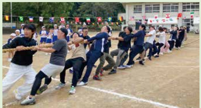
南地区合同体育大会