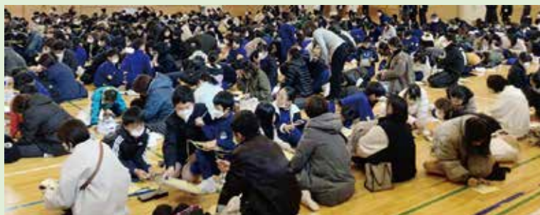
50年後の自分に手紙を書きました

育友会は地域の絆を深め、子ども達の成長と幸せな未来を願って、更なる活動に意欲を燃やしています。