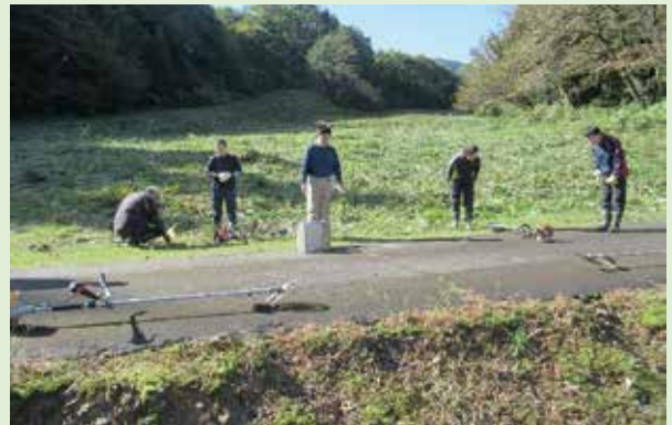
学校裏山スキー場草刈り

いずれにおきましても、役員の皆様や会員の皆様のご協力あっての活動となりました。今後とも、ご支援ご協力をいただきながら、子ども達が笑顔で楽しい学校生活を送れるように、見守っていきたく思います。