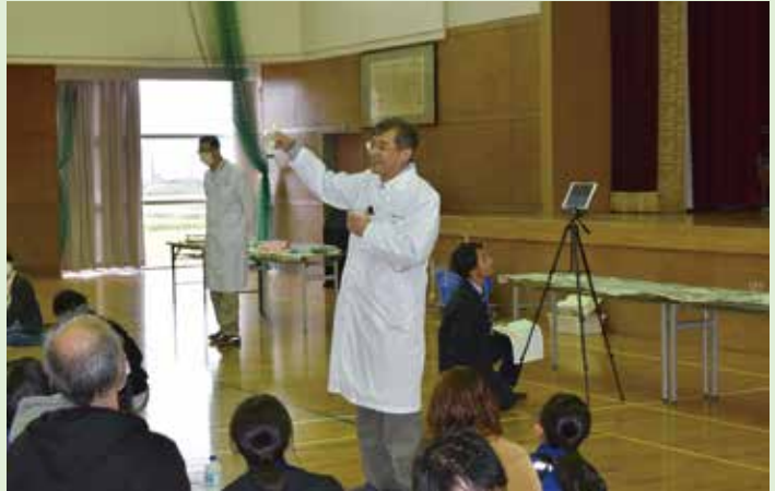
福井高専の先生方による理科実験教室

今後も子ども達には、興味・関心を持って、実際に経験を通したチャレンジをする機会を与えられるようなPTA活動に取り組んでいただけたらと願っております。