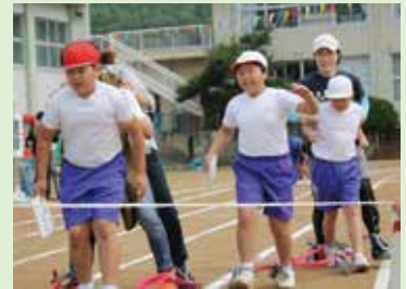
北地区合同体育大会「借り物競走」

最後に P T A 活動にご協力いただいた会員や地域の皆様、中高生それから先生方に深く感謝申し上げます。