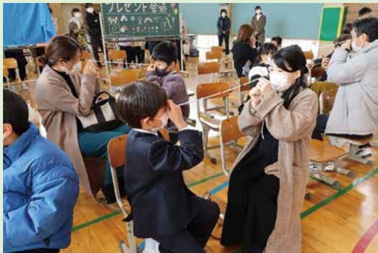
ロープの途中にある、色の球を両眼で見つめます

今年度は、数年続いていたコロナウイルスの感染対策が緩和され、様々なPTA活動がほぼ制限なく再開することができました。11月18日には、「NPOみるみえる」より講師をお招きして、「親子で楽しむビジョントレーニング」と題して親子のつどいを開催しました。普段からデジタル機器に触れる機会が多くなっている子どもや保護者が、講師の方のわかりやすい説明と紙芝居、また親子が実際に体験できるゲームを交えながら、ビジョントレーニングを行うことができました。子ども達が、保護者や先生方と一緒に楽しんでいる様子を見ることができ、本当に嬉しく思いました。今後も、子ども達が安心して楽しい学校生活が送れるようにPTA活動に取り組んでいこうと思います。